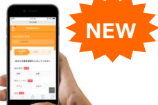
e-AMANO人事届出サービス