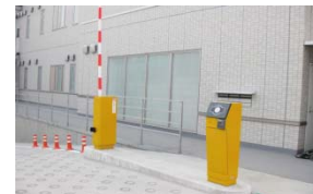
セキュリティゲートシステム