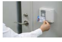
ドアセキュリティシステム