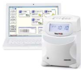
PC接続 タイムレコーダー