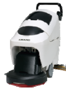
自動床面洗浄機EGシリーズ