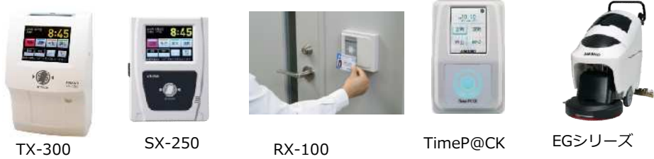
TX-300 SX-250 RX-100 TimeP@CK EGシリーズ